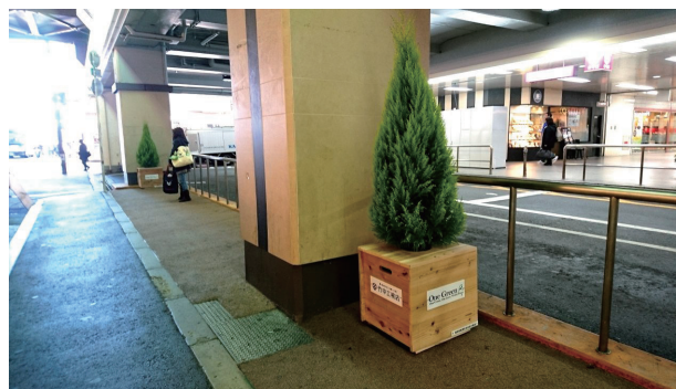
梅田バスターミナル