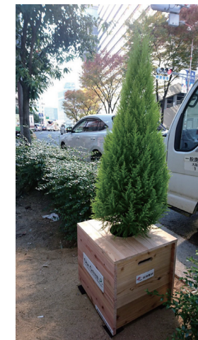
ヘップファイブ前（公道）