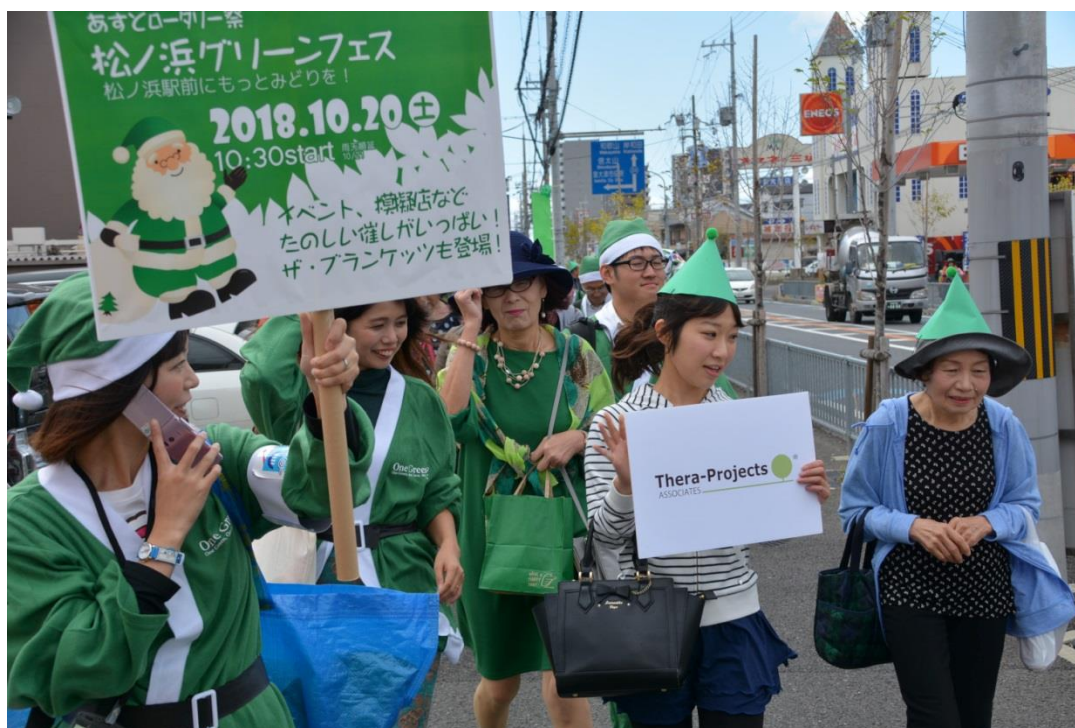
みどりのサンタウォーク③: FM いずみおおつ番組内で、電話による実況中継