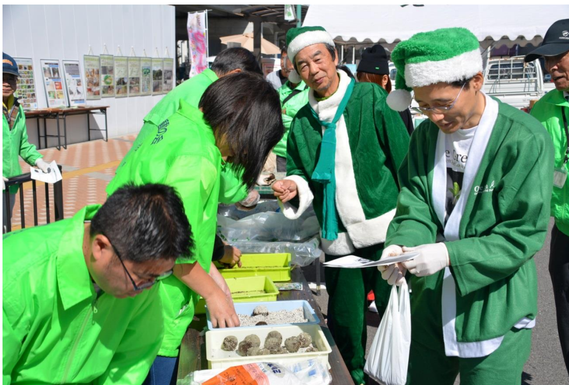
One Green イベント： 地元緑化ボランティア協会による種団子づくり