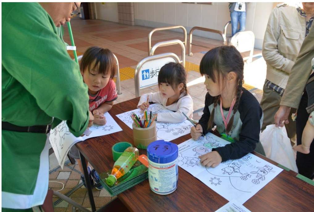
テラプロジェクト PR ブース