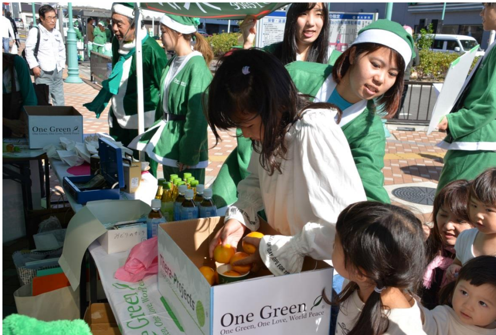
テラプロジェクト PR ブース