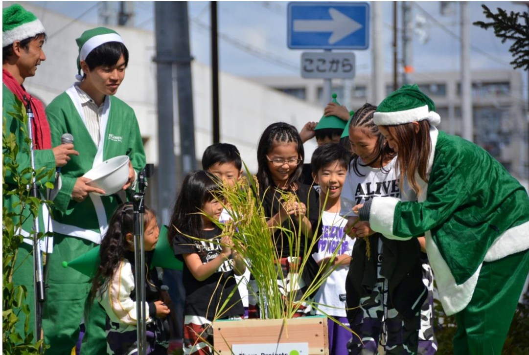
One Green みどりのサンタセレモニー：テラプロジェクト産学連携「植育」プログラム体験