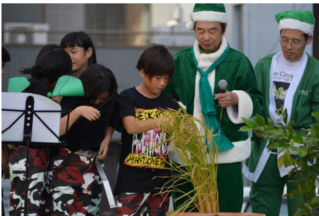
One Green みどりのサンタセレモニー： テラプロジェクトの産学連携活動および社会貢献活動 PR