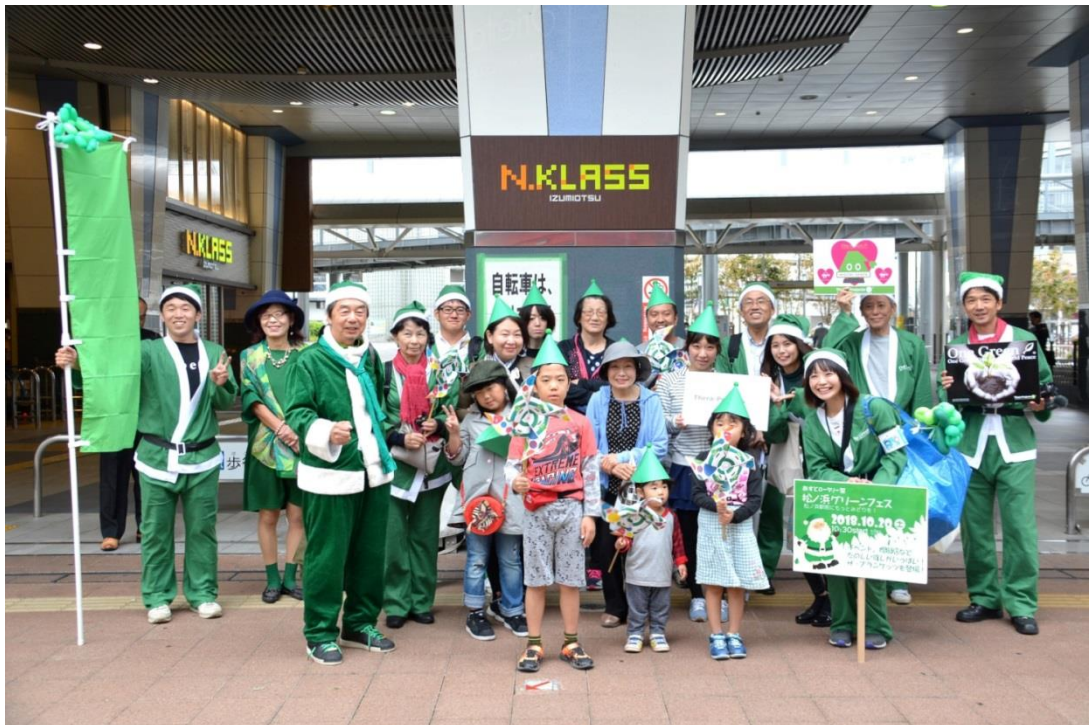
みどりのサントウオーク①:南海泉大津駅

泉大津市、FMいずみおおつの呼びかけで集まった住民と泉大津駅から松ノ浜駅までPR ウォーク 協力:南海電鉄