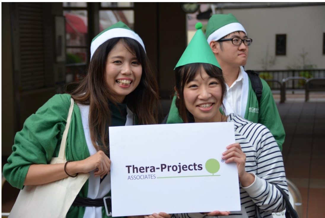
みどりのサントウオーク②:市民参加による PR ウォーク

泉大津市、FMいずみおおつの呼びかけで集まった住民と泉大津駅から松ノ浜駅までPR ウォーク 協力:南海電鉄