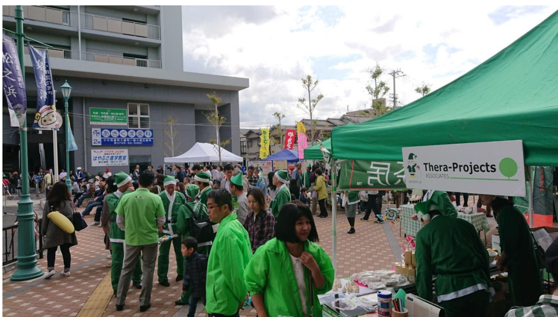
連携協定校 羽衣国際大学(PBL)履修生によるテラプロジェクト PR ブース