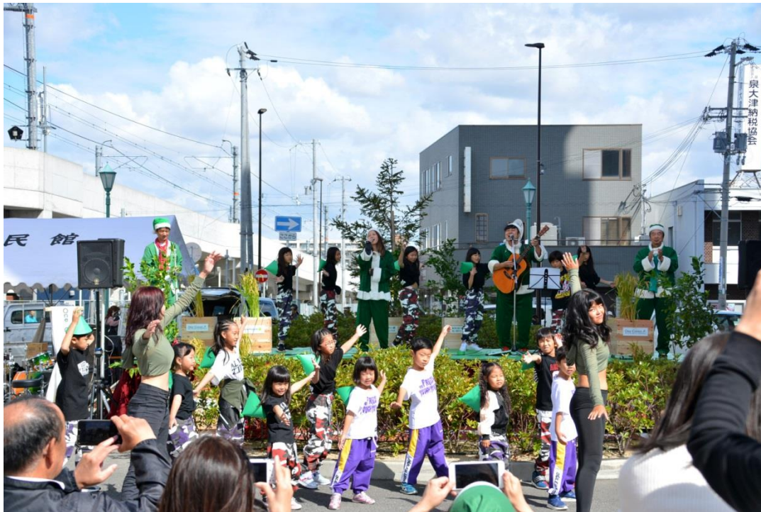
One Green みどりのサンタセレモニー：大学発人工知能(AI)作曲による社会貢献活動応援ソングに地元キッズダンサーが参加。