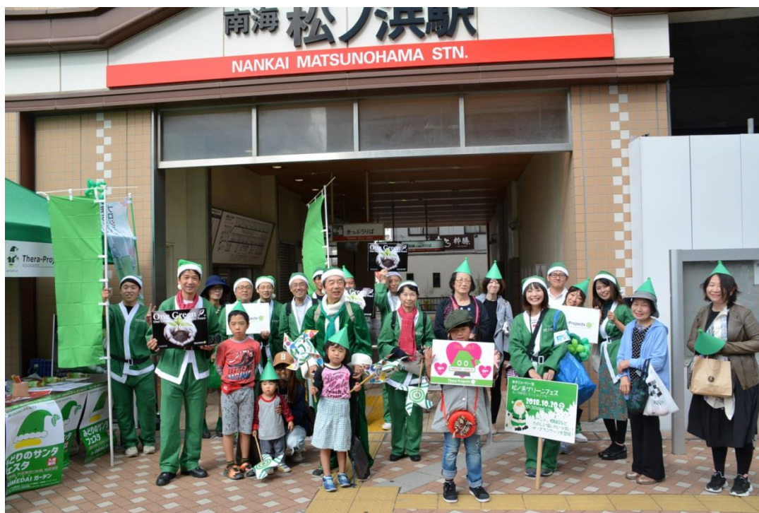
みどりのサンタウォーク④: 南海松ノ浜駅到着