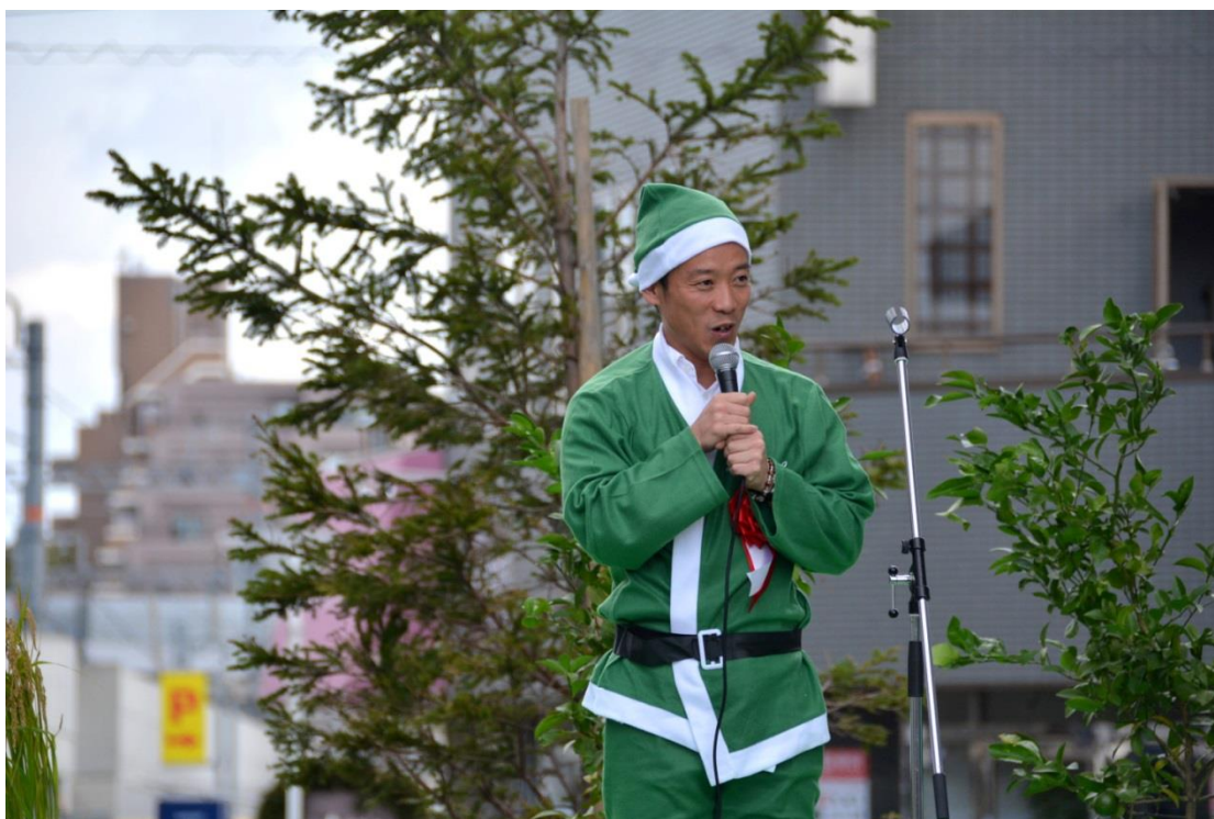
開会式： 南出賢一市長挨拶