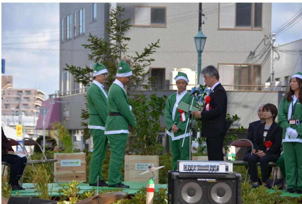
目録： 泉大津市、鹿島建設より南海松ノ浜駅前設置用の One Green レモンの木が贈呈