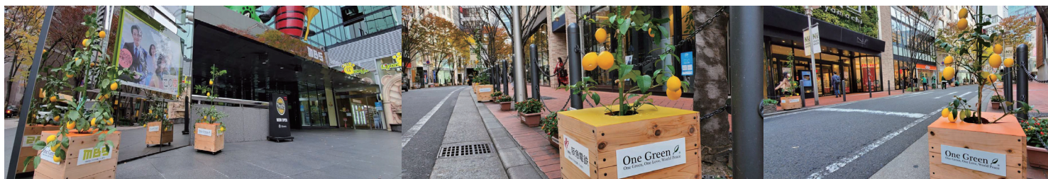
レモンの木イメージ

テラプロジェクトホームページ内「One Green 宣言」にてご芳名を披露する。