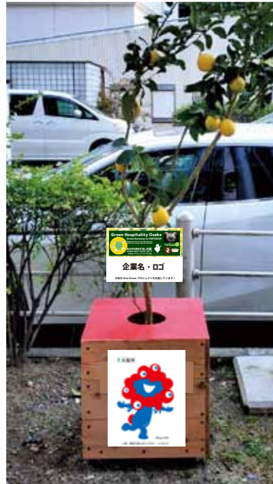
大阪市との連携による万博の機運醸成を目的とした「植育」BOXを使用します。