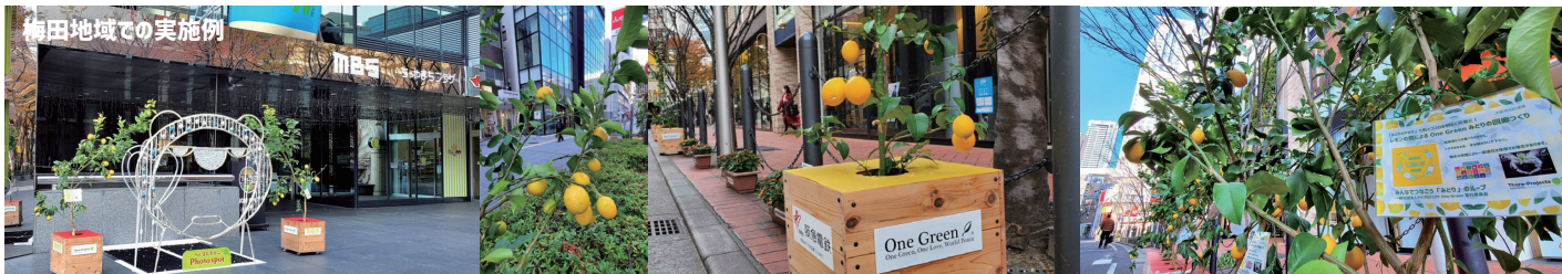
レモンの樹イメージ

標記の際には、「大阪の One Green プロジェクトを応援しています」を明記する。