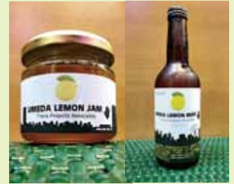
成果物一例：レモンジャム、レモンビール *成果物は果実の収穫量により商品が異なります。

↑企業名・ロゴ掲載：A4の1/2スペース *公道に設置する場合は、掲載スペースが異なります。（公道ははがきサイズ以下）