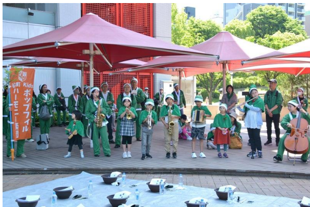
谷町・本町キッズ楽団（きらきら星、聖者の行進）