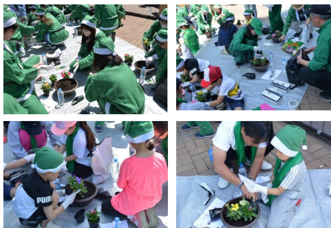
年長～大学生、社会人による寄せ植え作り。3種（ジニア、ペンタス、ペチュニア）のお花を植えました。