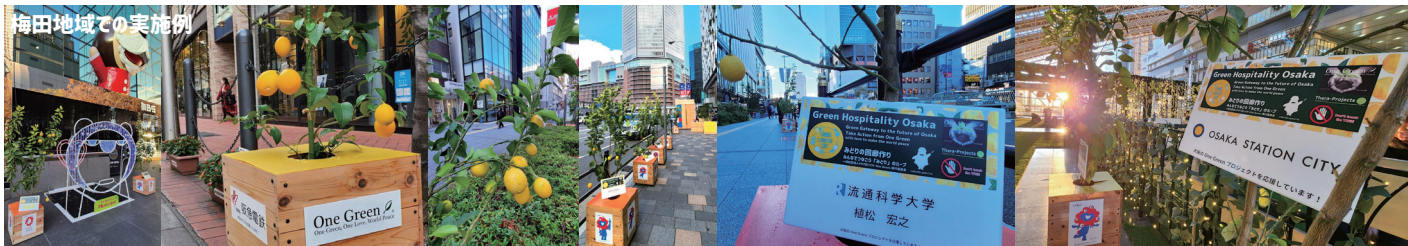
レモンの樹イメージ

標記の際には、「大阪の One Green プロジェクトを応援しています」を明記する。