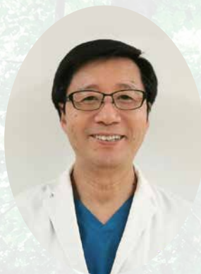
一般社団法人 日本森林医学会 代表理事・会長

また、全国自治体連携組織、日本みどりのプロジェクト推進協議会や智の木協会等と連携し、本学会を盛り上げていきたいと思ひます。森林・都市緑化、アグリビジネスなど「植物の限りない能力」に興味をもたれる企業、異分野の方々や専門家の参加を期待しています。